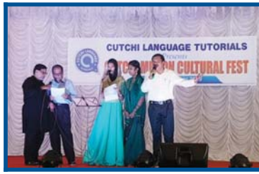
GROUP SONG, PAANJOKUTCHI BOLI...