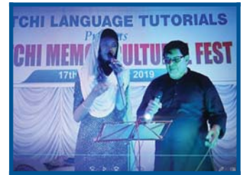
ASLAM & MEHTAB GUN GUNA RAHE...