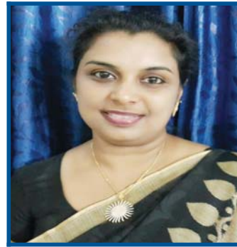
By— Mrs. Sajna Sheby.